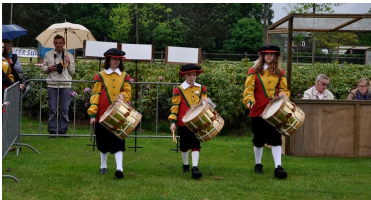
De Budelse Jeugdtamboers tijdens Jeugdtoernooi 2016 Aalst-Waalre.